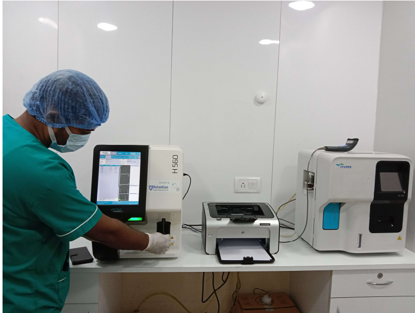
Laboratorio di patologia clinica