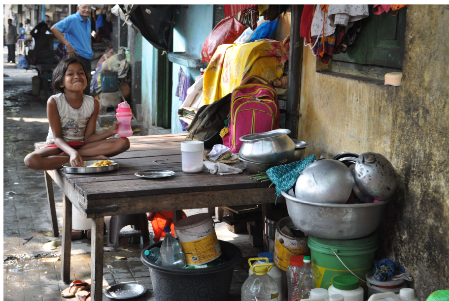
La vita sui marciapiedi, con i loro pochi averi, senza alcun riparo né protezione