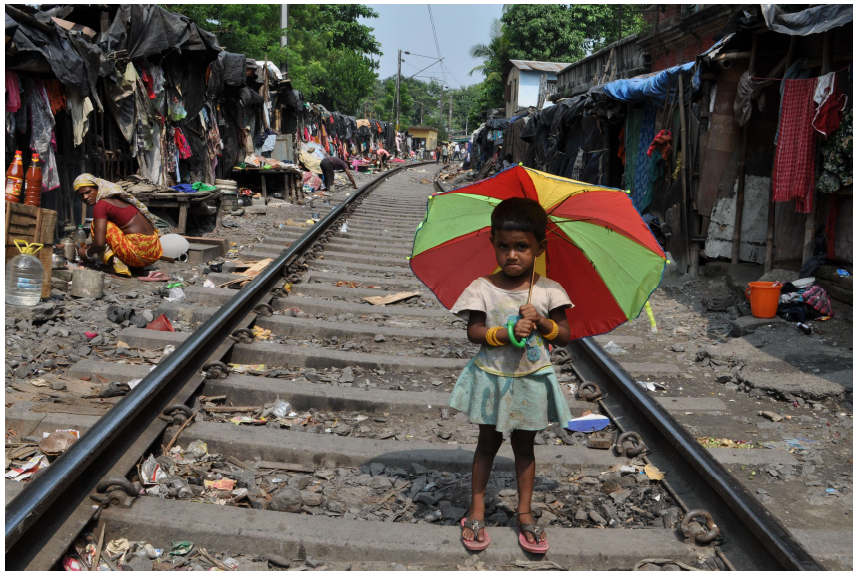
La vita in uno slum lungo binari del treno