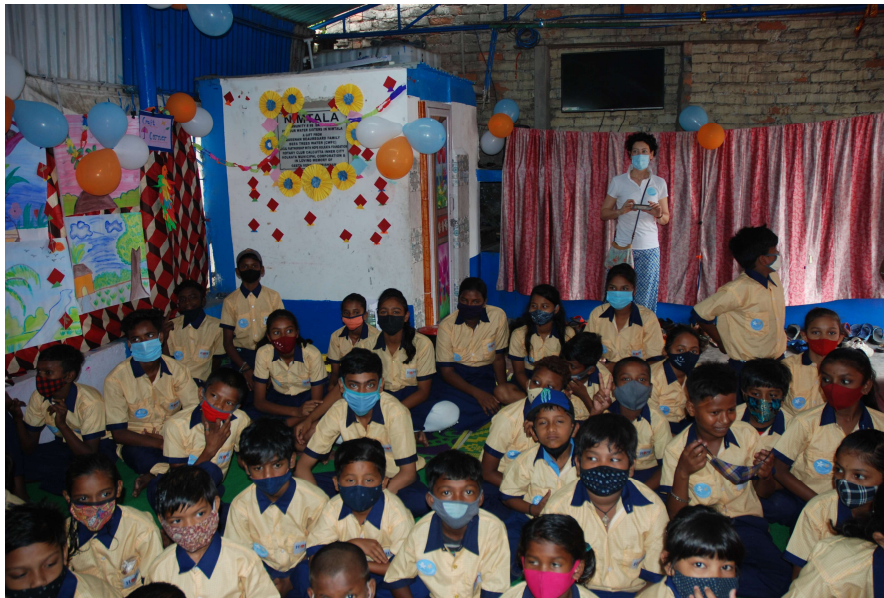
I nostri bambini di Nimtala