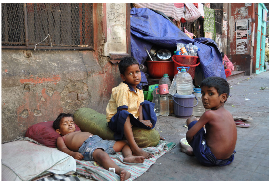
Bambini che dormono, studiano, mangiano sui marciapiedi di Calcutta