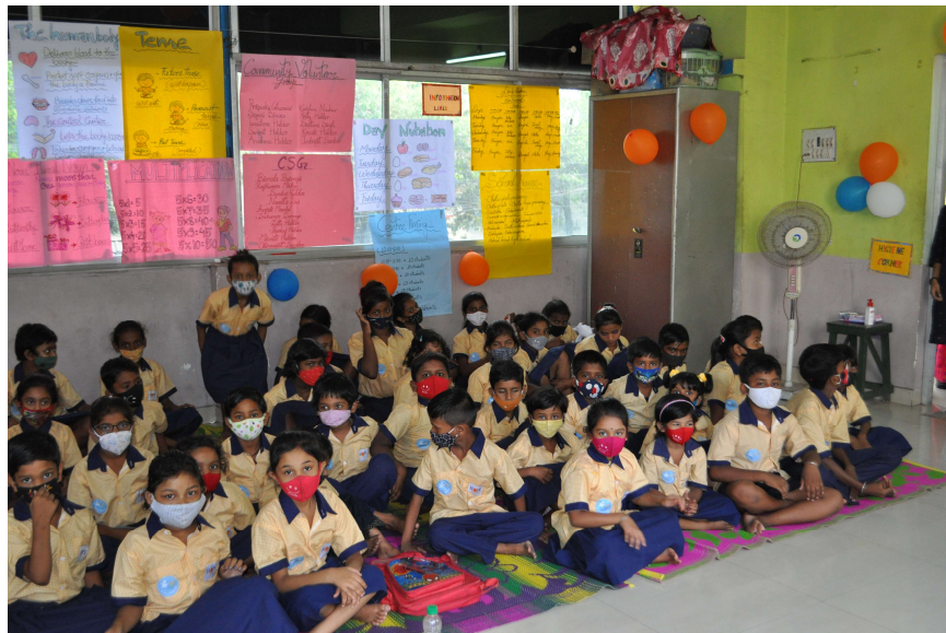
I nostri bambini di Chetla