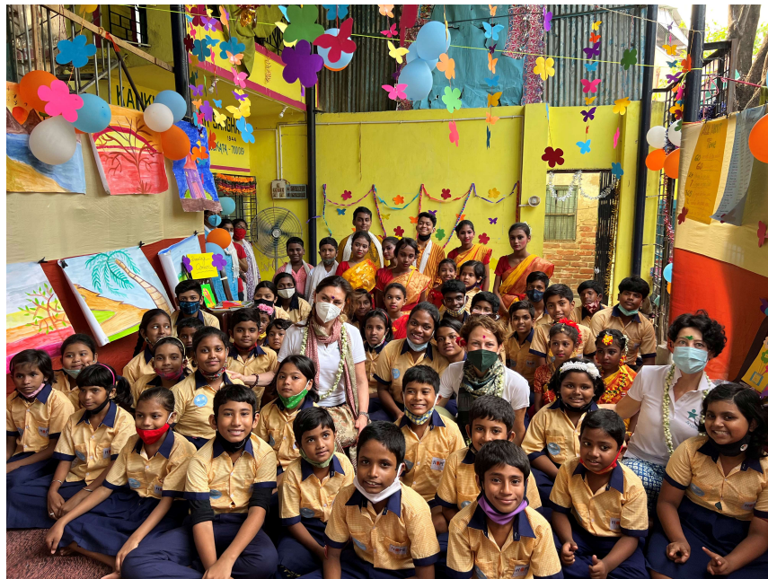
Marzo 2022, con le socie Skychildren, dopo due lunghi anni di pandemia

Dopo due lunghi anni di restrizioni e di lockdown finalmente possiamo riabbracciare i nostri bambini!