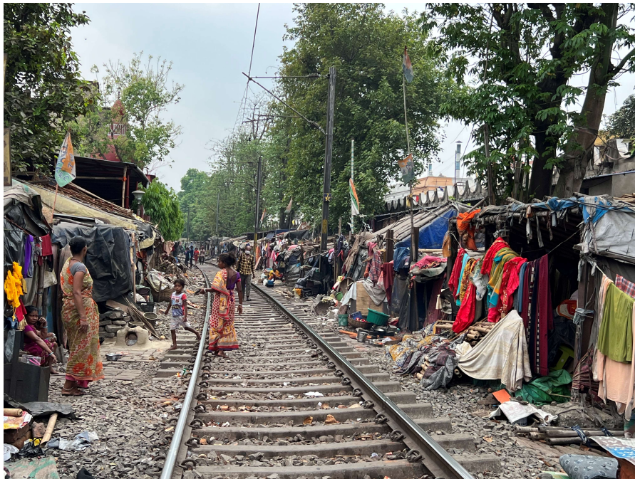
Lo slum sui binari dove vivono alcuni dei bambini che frequentano le nostre scuole