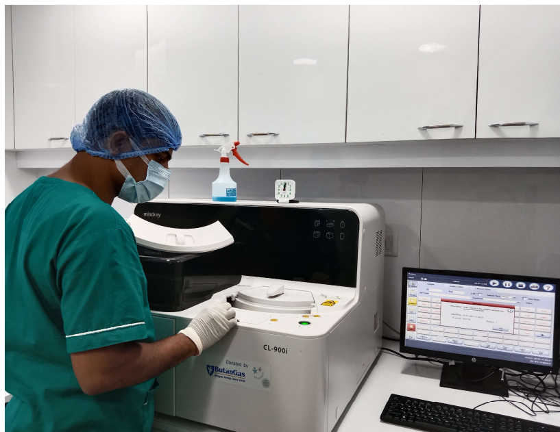
Laboratorio di immunochimica