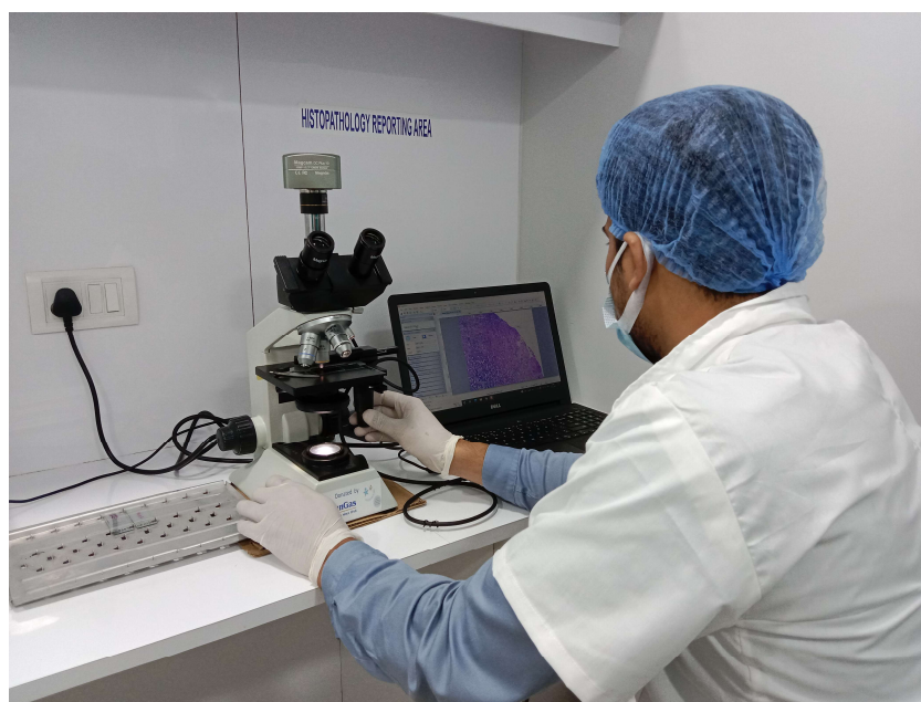
Laboratorio di istopatologia