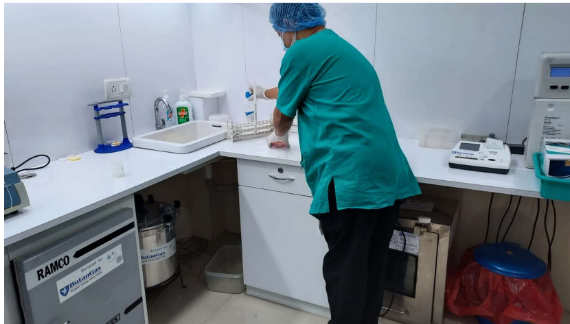
Laboratorio di microbiologia