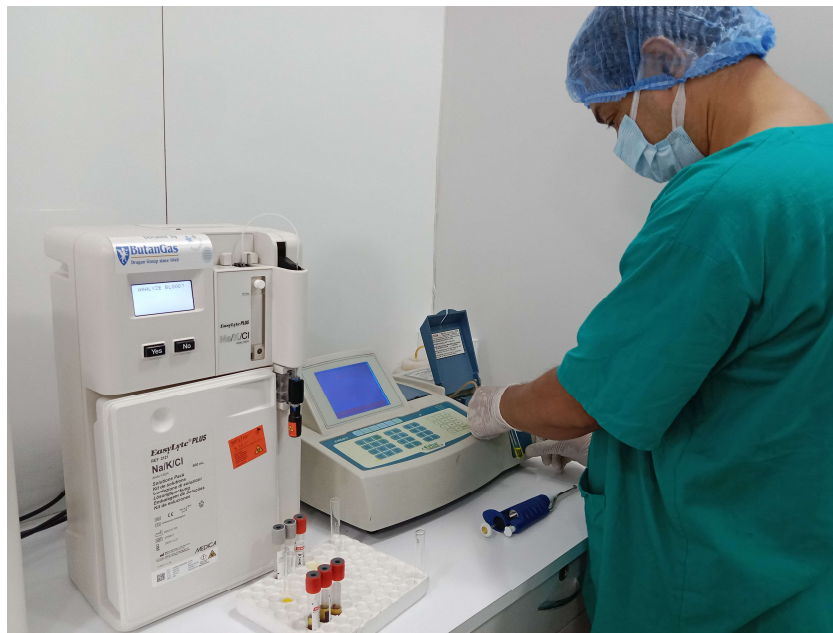
Laboratorio di analisi biochimica