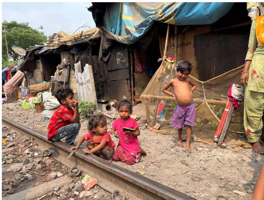
Bambini che mangiano e giocano di fronte alla loro "casa"