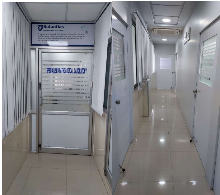
Ingresso al laboratorio di analisi