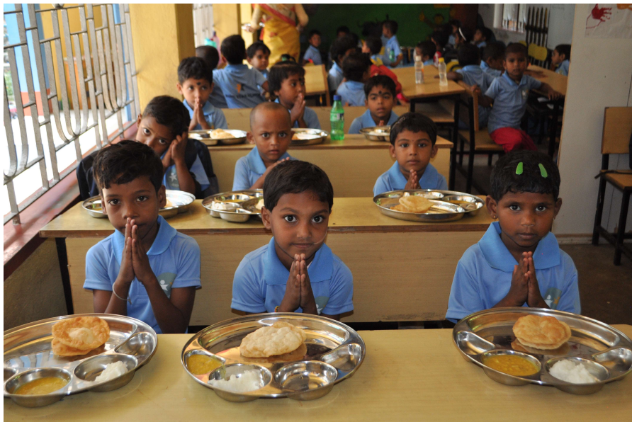
I nostri bambini sui banchi di scuola con un pasto caldo