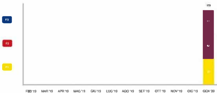
Grafico consumi In kWh

Consumo da inizio fornitura (solo se inferiore ad un anno): 173 kWh